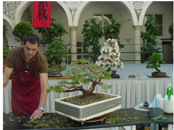
Der italienische Wacholder