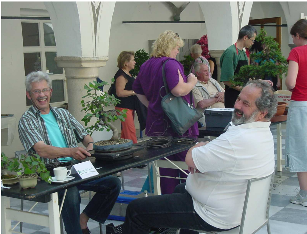
Bayerisch-Kärntnerische Gemütlichkeit nach vollendeter Arbeit